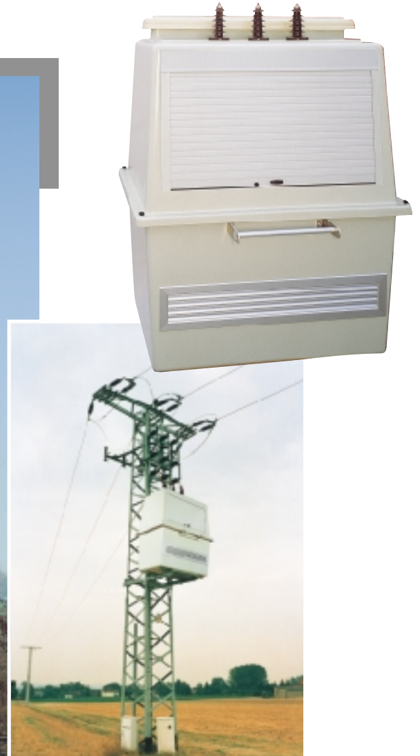
Die ELSIC -TrafoBoxen sind in drei Größen erhältlich (Tabelle Rückseite).