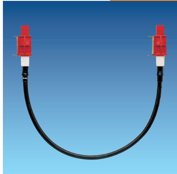
Ausführung zur Betätigung mit Aufsteckgriff, passend für NH-Sicherungsunterteile Gr. 1; 2 und 3.