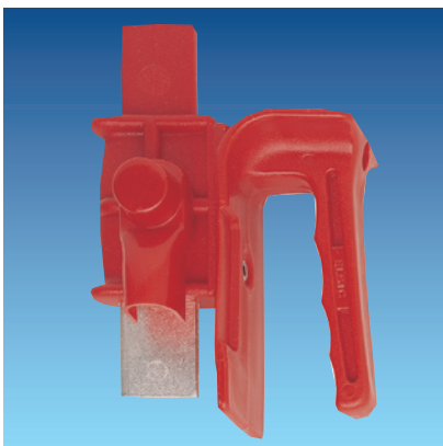
Kurzschließhandgriff (einzeln) Bestell-Nr. 2633

Auf Wunsch kann der Handgriff bzw. der Aufnahmebügel unterlegt werden (Bestellzusatz U ). Dies ist vorteilhaft bei abgedeckten Aufnahmekontakten.