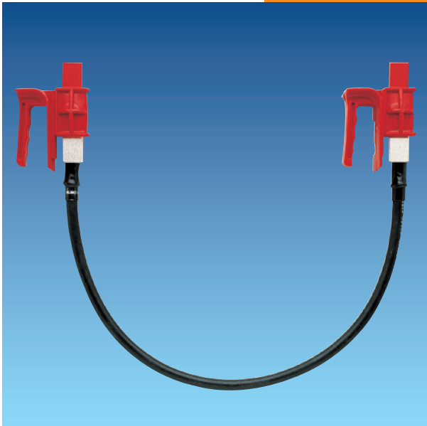
Ausführung mit fest angesetztem Handgriff, passend für NH-Sicherungsunterteile Gr. 1; 2 und 3.

Zum Verbinden zweier Niederspannungssysteme