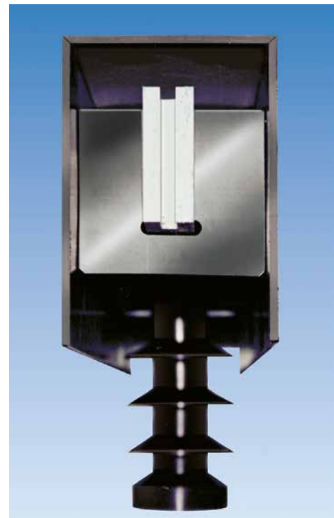
Querschnitt durch eine Verschiebung mit Distanzhaltern und Abdeckungen

Gerne unterbreiten wir Ihnen ein auf Ihre Anlage abgestimmtes Angebot.